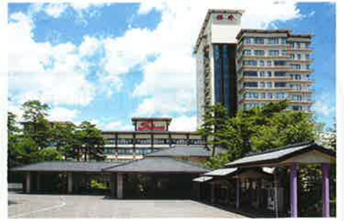
草津温泉 ホテル櫻井