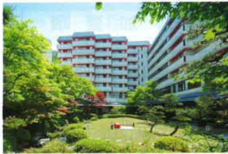
鬼怒川グランドホテル 夢の季