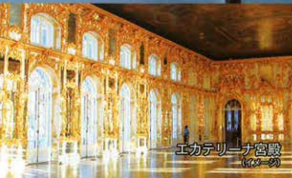
エカテリーナ宮殿 (イメージ)