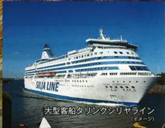
大型客船タリンクシリヤライン (イメージ)