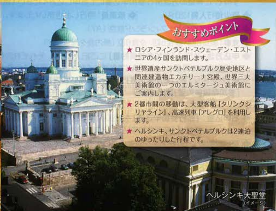
ヘルシンキ大聖堂 (イメージ)