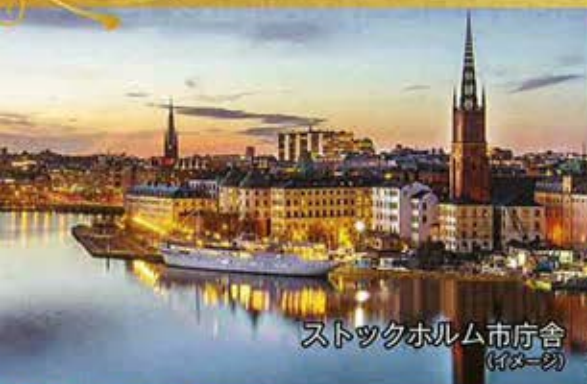
ストックホルム市庁舎 (イメージ)