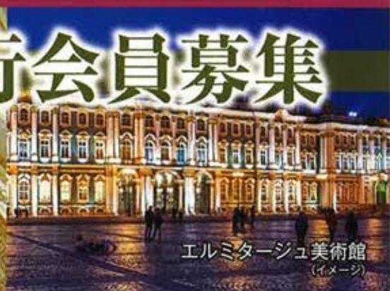
エルミタージュ美術館 (イメージ)