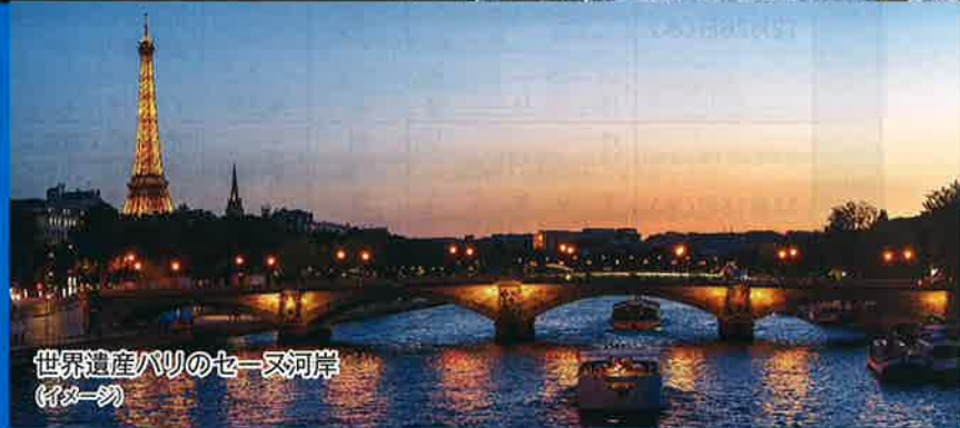
世界遺産パリのセーヌ河岸 (イメージ)