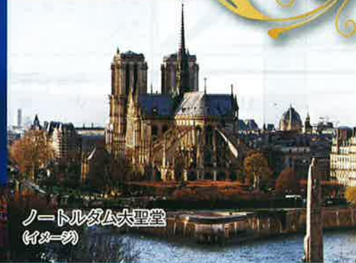
ノートルダム大聖堂 (イメージ)