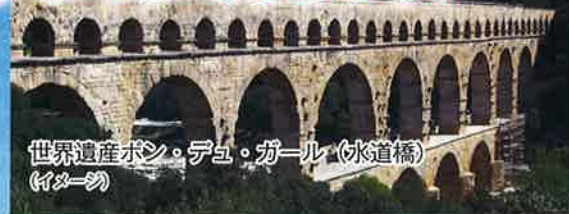
世界遺産ポン・デュ・ガール(水道橋) (イメージ)