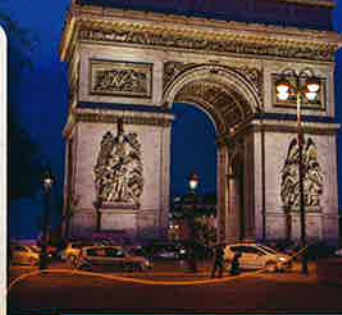
エトワール凱旋門 (イメージ)