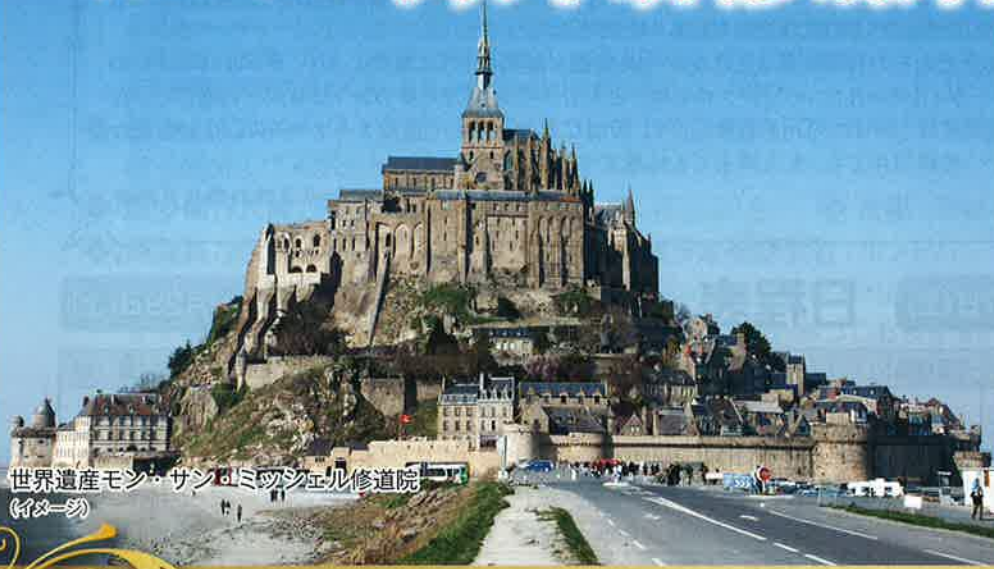
世界遺産モン・サン・ミッシェル修道院 (イメージ)