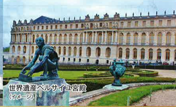
世界遺産ベルサイユ宮殿 (イメージ)